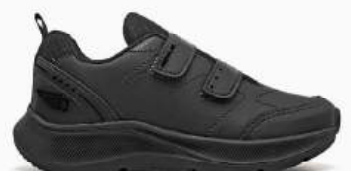
05 PRETO COLEGIAL