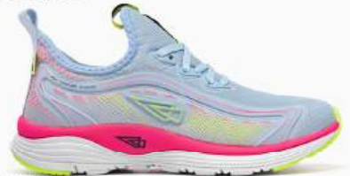
08 AZUL BB