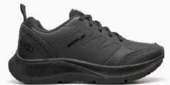
05 PRETO COLEGIAL