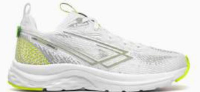
35 BRANCO/AMARELO LIMÃO

O design é o grande diferencial na LINHA PRIME . Produtos com solas em eva ou micro expandido e cores que acompanham as tendências do mercado da moda esportiva. Os tênis da linha PRIME são indicados para caminhadas, treinos na academia e prática de esportes leves. Devido ao design singular, são um diferencial nas composições de looks despojados e criativos para o dia a dia ou para sair à noite.